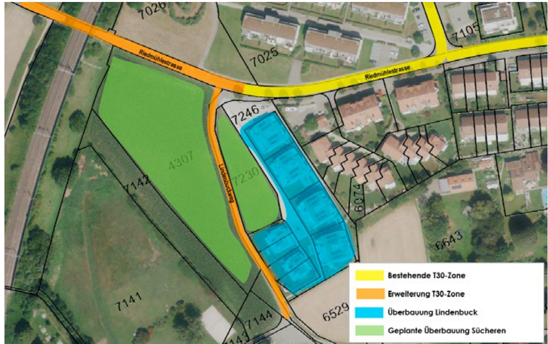
Erweiterung Perimeter Tempo 30-Zone Im Talacher, Brüttisellen.

Für eine Ausdehnung der bestehenden Zone spricht zudem der für das kommende Jahr geplante Neubau der Überbauung Sücheren. Die neue Siedlung entlang der Strassen Riedmühlestrasse und Lindenbuckweg gebaut.