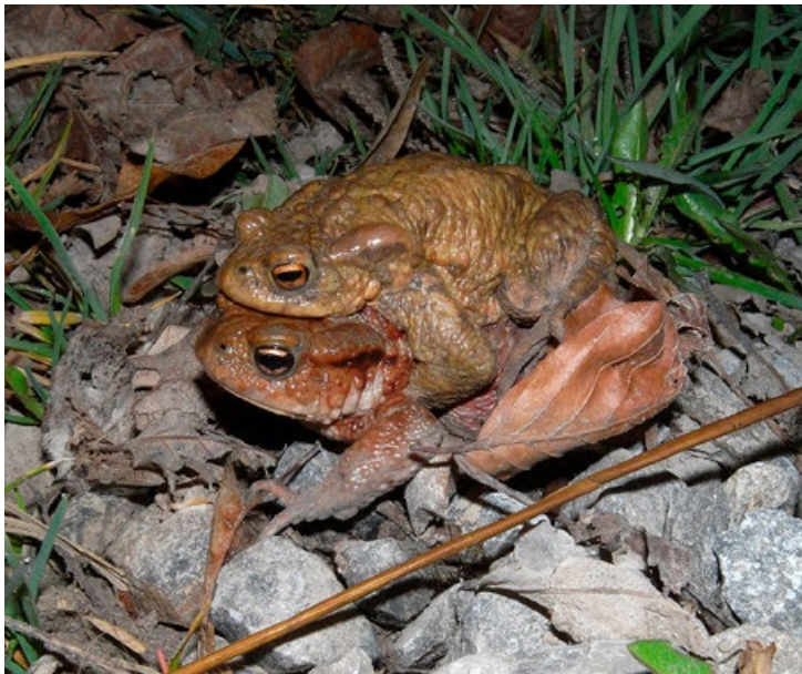
Die Erdkröte ist bei ihren Wanderungen besonders durch Strassen gefährdet.