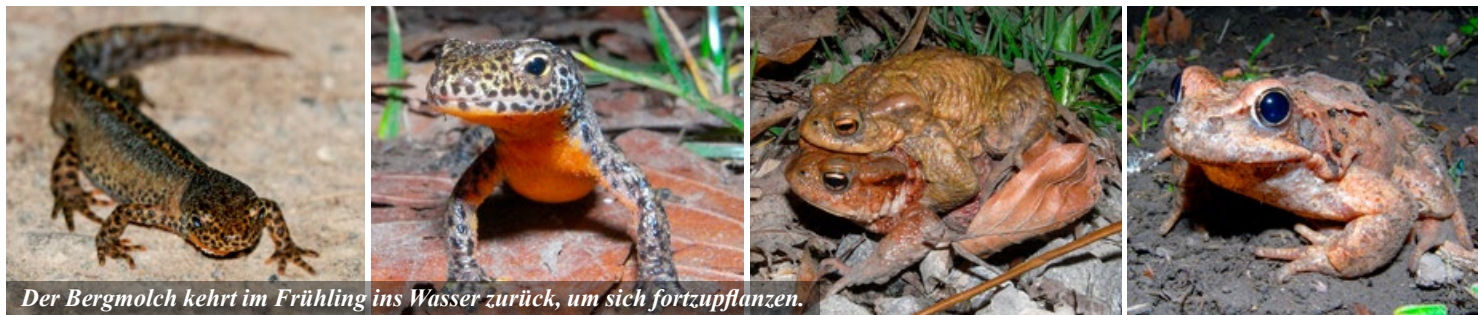
Der Bergmolch kehrt im Frühling ins Wasser zurück, um sich fortzupflanzen.