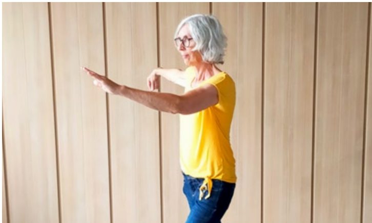
Tai Ji trainiert die innere, feinere Muskulatur und weiche Kraft.

Tai Ji ist eine alte Methode der Gesunderhaltung, Krankheitsvorbeugung und Heilung. Vitaswiss Dietlikon bietet dazu einen Workshop an.